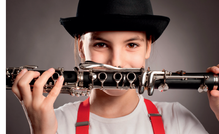
Gemeinsam ist man stark!