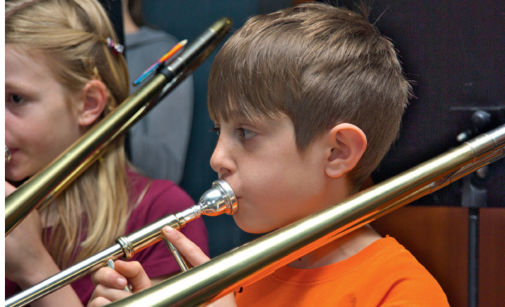
Bläserklassen am Cato ...