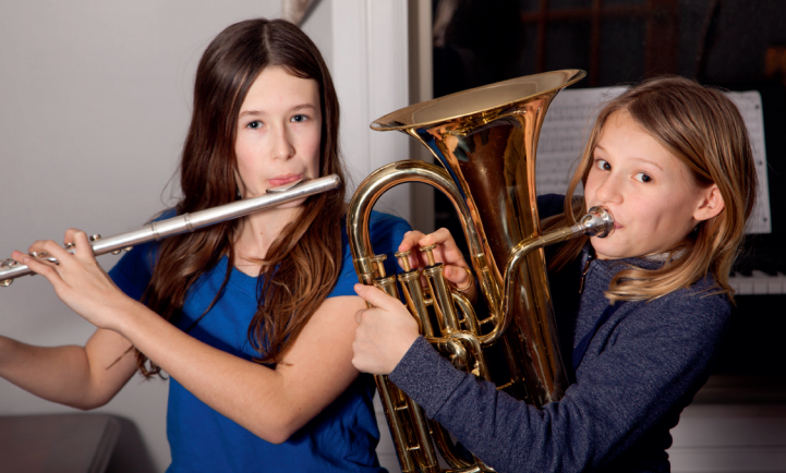
Die Bläserklasse ist ...